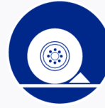
Remblokken verplicht Sabots obligatoires