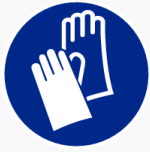
Veiligheidshandschoenen verplicht Protection des mains obligatoire