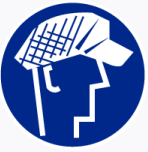
Heren haarnet verplicht Coiffe messieurs obligatoire