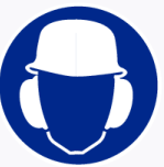
Helm en oorkap verplicht Casque et équip. anti-bruit obligatoire