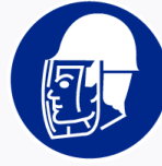
Gelaatsbescherming verplicht Protège-face obligatoire