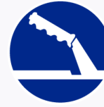
Handrem verplicht Frein à main obligatoire