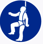
Individueel veiligheidsharnas verplicht Protège-chute obligatoire