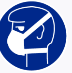
Stofmasker verplicht Casque anti-poussière obligatoire