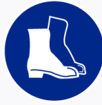
Veiligheidsschoenen verplicht Protection des pieds obligatoire