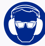
Bril en oorkap verplicht Lunettes & casque obligatoire