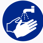
Handen wassen verplicht Lavez les mains obligatoire