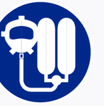
Ademhalingsapparaat verplicht Appareil respiratoire obligatoire