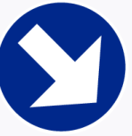
Verplichte richting Direction à suivre obligatoire