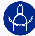
Gasfles verankeren verplicht Ancrer la bouteille de gaz obl.