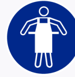
Veiligheidsschort verplicht Tablier de sécurité obligatoire