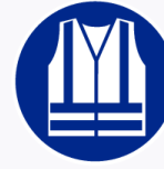
Signalatievest verplicht Gilet signalisation obligatoire