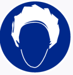
Dames haarnet verplicht Coiffe dames obligatoire