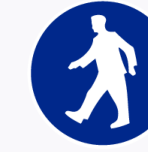
Doorgang toegestaan Passage autorisé