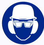
Helm, bril en oorkap verplicht Casque, lunettes et équip. anti-bruit obl.