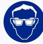
Oogbescherming verplicht Protection des yeux obligatoire