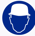
Veiligheidshelm verplicht Casque obligatoire