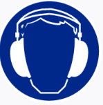
Gehoorscherming verplicht Casque anti-bruit obligatoire