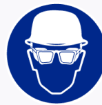
Helm en bril verplicht Casque & prot. des yeux obligatoire