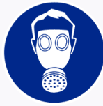
Adembescherming verplicht Protection des voies respiratoires obligatoire